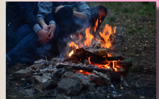
Austausch am Lagerfeuer