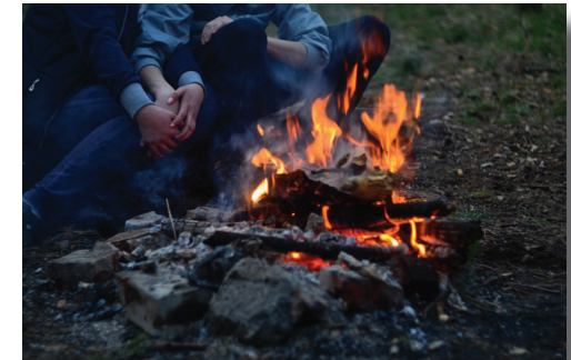
Austausch am Lagerfeuer